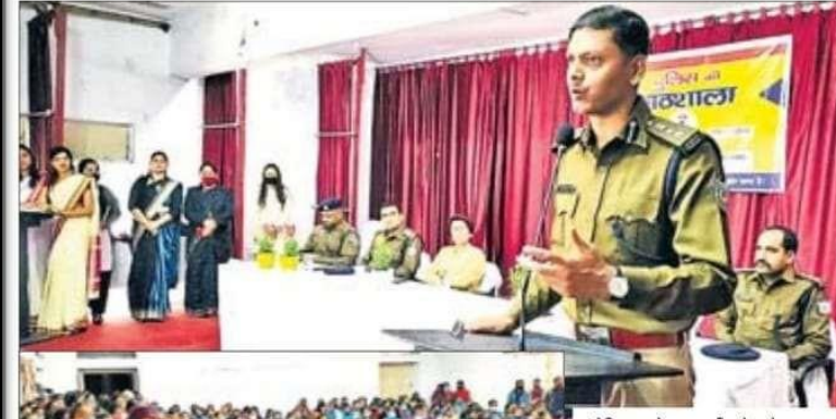
संबोधित करते एसएसपी और मौजूद छात्राएं