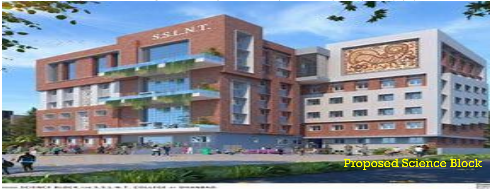
Proposed Science Block